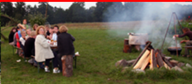
Grill- & Lagerfeuerplatz