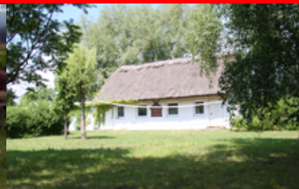
Volleyballplatz vor Korbflechterei

Da bei Ihrem Aufenthalt keine anderen Personen außer unseren Kursleitern anwesend sein werden, ergeben sich für Sie und Ihre Gruppe viele Freiheiten. Der Alltag während eines Kurses bietet zusätzlich zum Programm eine Fülle an Lernsituationen, die sich unmittelbar auf die Lebenswelt der Teilnehmer beziehen, dazu gehören: