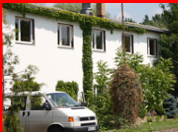
Haus am Storchennest